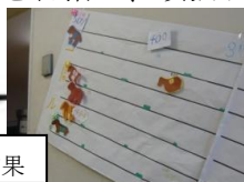
学年向上運動採点結果

1組 は、合唱コンクールや向上運動で団結が高まり、仲が深まりました。合唱コンクールでは、練習が始まったときからW最優秀賞を目指してクラスみんなが心を一つに精一杯練習しました。W最優秀賞は取れませんでしたでしたが、最優秀歌唱賞をとることができて、クラスの絆が強まったことを実感しました。また、向上運動のときは一つ一つ着実に達成し、クラスの課題であったチャイム着席やあいさつができるようになってきました。3学期は合唱コンクールで強まった絆で、向上運動5連覇を目指し、頑張ります。