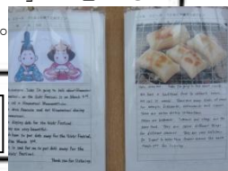
日本文化を 英作文で説明。

4組 は、文化祭後に3年4組6箇条を作りました。それは、文化祭で良かったこと、学んだことをもとに、これからの学校生活に生かしていきたいことを班で一つずつ出し合ったものです。これを作ってからクラスが生き生きしてきて、団結力が深まりました。また、1学期から取り組んでいる残食0を守り、クラスで協力して、全て食べることができました。3年4組でいられる時間もあと3ヶ月です。3年4組6箇条をこれからも忘れずに、卒業のときには「3年4組で良かった」と思えるクラスにしたいです。