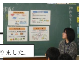
栄養指導がありました。

2組 は、文化祭・合唱などの行事を通して、とても仲が良くなることができました。しかし、仲が良すぎることで、休み時間中おしゃべりに夢中になってしまい、ベル着ができないということが多くありました。3学期では、授業の始めと終わりのあいさつを大きな声でしたり、ベル着をしたりすることを意識できるようにします。そして、2組の長所である「仲の良さ」を利用して、互いに呼びかけあい、今まで全てビリだった学年向上運動で 1位 をとりたいと思います。