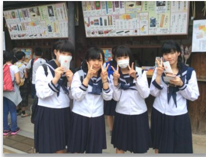
天満宮で合格祈願