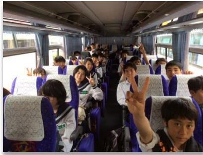
帰りのバスの中でも元気