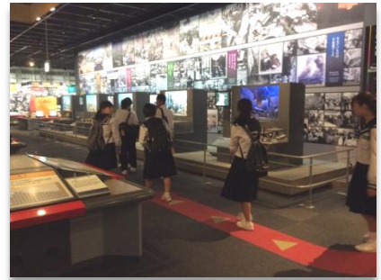
人と防災未来センター

神戸の班別学習では、ハーバーランドのumie モザイクにある魔法の壺プリンや、南京町の中華料理など色々なものを食べて楽しみました。26階の高さにあるホテルのレストランで夕食も食べました。神戸で食べたものは、どれも美味しかったです。