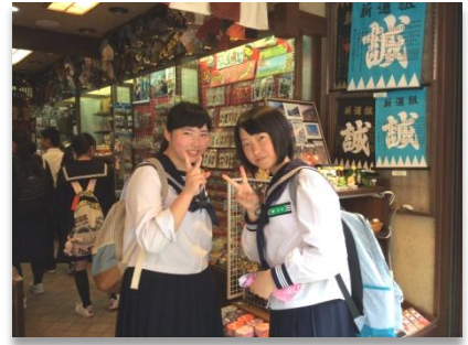
おみやげ、買えたかな？

京都には、歴史や文化を感じさせる建物が数多くあります。二条城では桃山から江戸への文化の移り変わりを見ることができ、その時代ごとの文化が感じられました。また、清水寺の柱は釘を使わない構造で、当時の技術の高さを感じました。京都は歴史と共に文化や技術も変化していて、現在と過去の合わさった素晴らしい場所だと思いました。