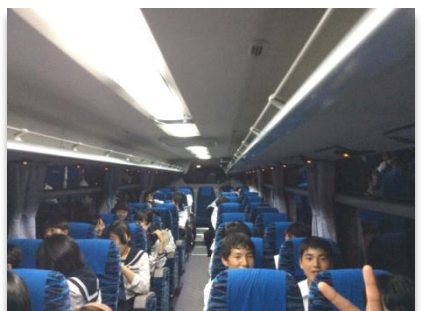
劇団四季からホテルへ移動中

神戸では、町並みの美しさや食べ物の美味しさをしっかりと感じ取ることができました。劇団四季のライオンキングは、以前にディズニーの映画を見たことがありましたが、迫力があって素晴らしい演出で、とても楽しかったです。