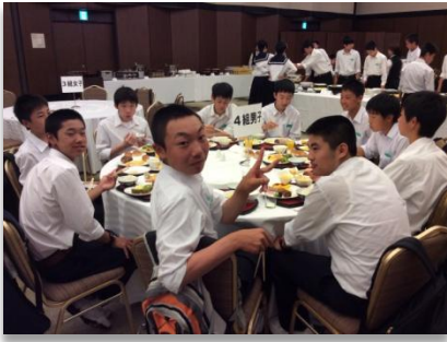
朝食はバイキング