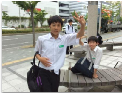
歩き疲れてちょっと休憩