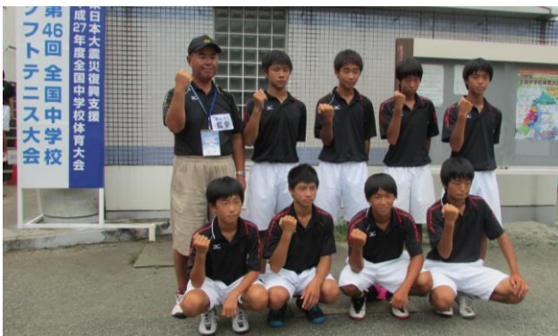
初出場 男子ソフトテニス部 団体メンバー