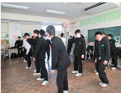
←ダンス係 「ここの振付は・・・」