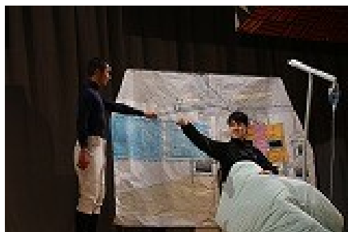
だい8幕「お前が野球やってる姿が父さんの生きがいなんだ」