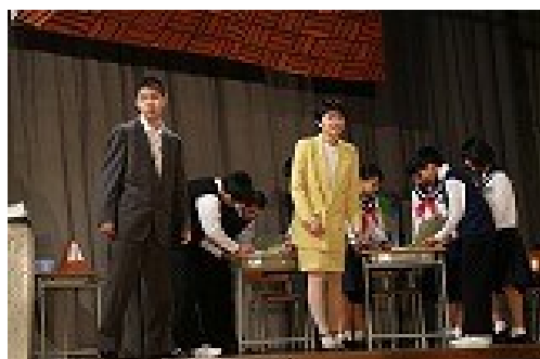
第4幕「分かったでしょ？なんで歌いたいのか」