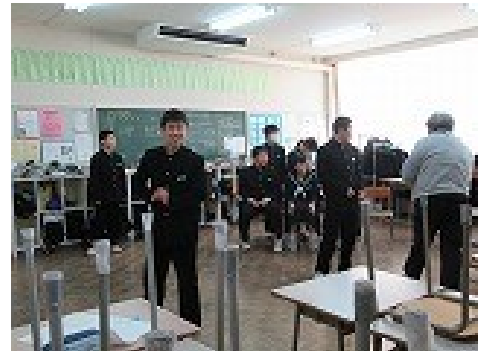
劇係→ 「台詞は・・・」