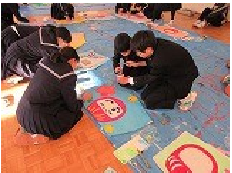
←プレゼント係 「だるまの周りを・・・」