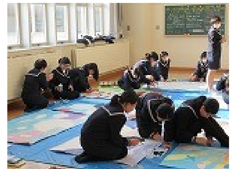
教室飾り係→ 「この色でいいかな・・・」