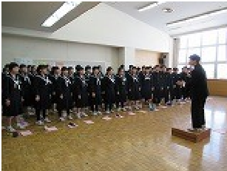
←合唱係 「声を大きく・・・」