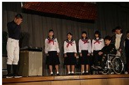
第16幕「お前は俺の自慢の・・・」