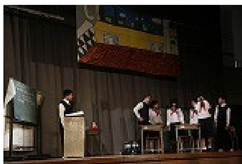
第3幕「ここ合唱部の部室なんですけど」