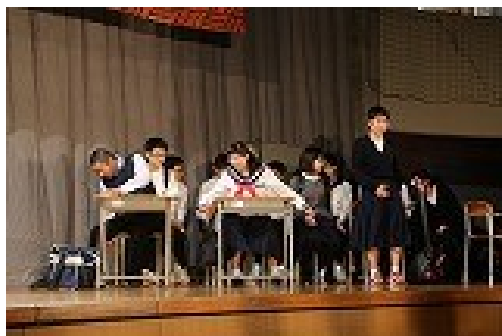
第一幕「やっちまったー！」