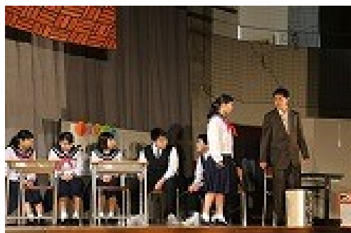
第11幕「まさか俺が感染なんて？」