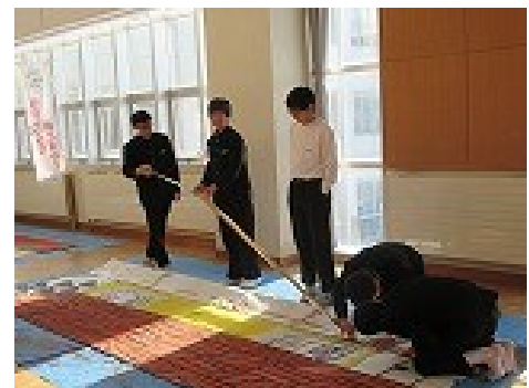
大道具係→ 「ステージに吊り下げるために・・・」