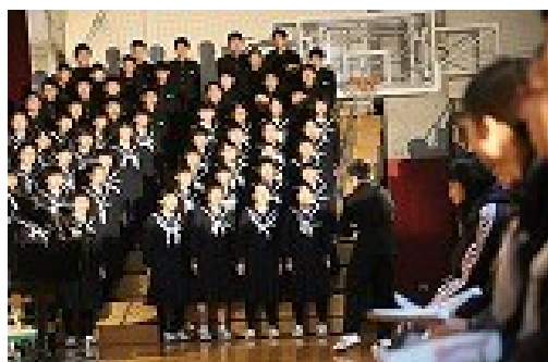
応援の合唱を熱唱中